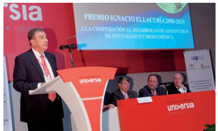
El Consejero de Educación de la JCyL agradeciendo la concesión del Premio Ignacio Ellacuría