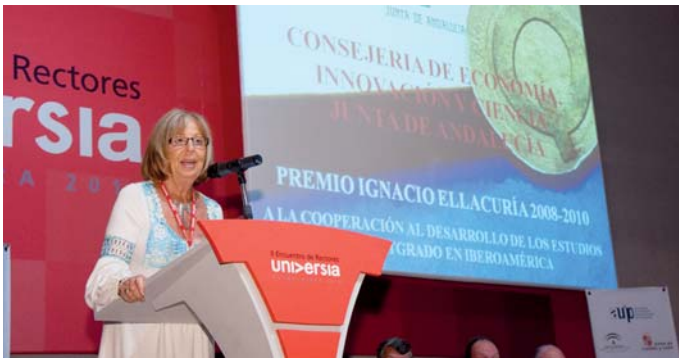
La Rectora de la Universidad de Málaga en representación de la Junta de Andalucía