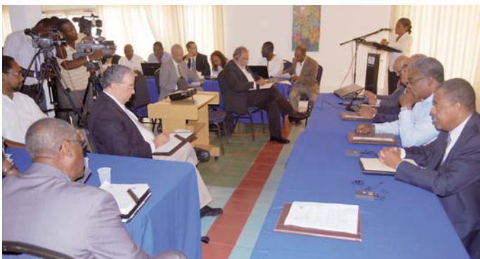
Reunión en Puerto Príncipe, Haití