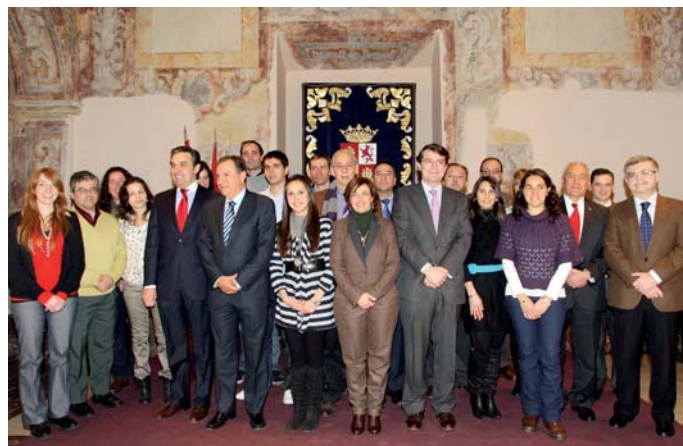
Reunión de becarios, autoridades de la Junta de Castilla y León y directivos de la AUIP

Fundación Universidades de Castilla y León y Fundación para la Ciudadanía Castellana Leonesa en el Exterior y la Cooperación al Desarrollo: Se suscribió un nuevo Convenio de Colaboración con las dos Fundaciones para convocar, en 2010, 17 becas de 10.000 € cada una dirigidas a latinoamericanos descendientes de castellanos y leoneses interesados en cursar títulos oficiales de postgrado en universidades de Castilla y León, para un total de 170.000 €.