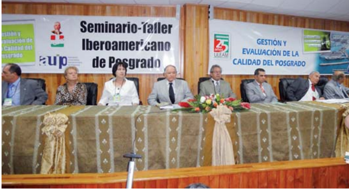
Inauguración del seminario en Manta, Ecuador