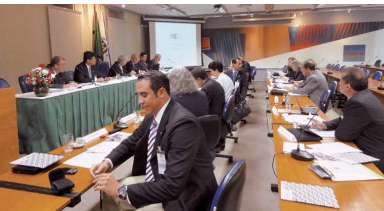
Reunión de la Comisión Ejecutiva en UNICAMP, Brasil