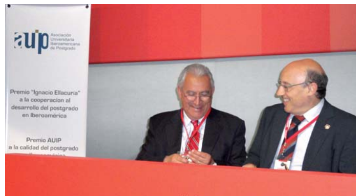
El Director General de la AUIP y el Rector de la Universidad de Cantabria en la firma del convenio