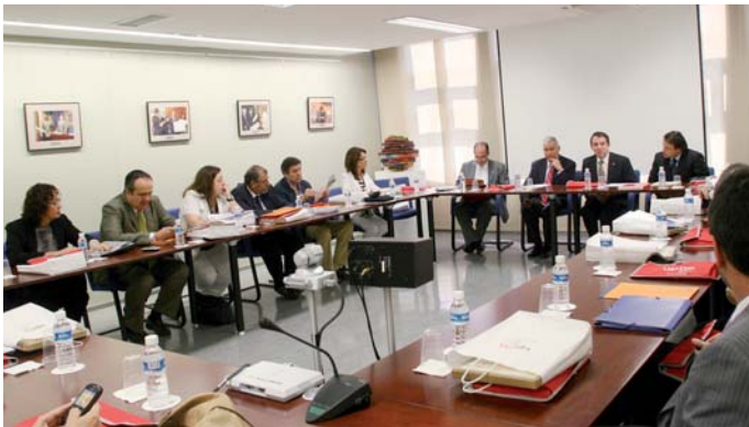
El Rector de la UPNA inaugurando la reunión de Directores Regionales

propia Asociación. El tema central de la reunión, sin embargo, fue el debate al que se sometieron los resultados del Estudio sobre el Postgrado en Iberoamérica.