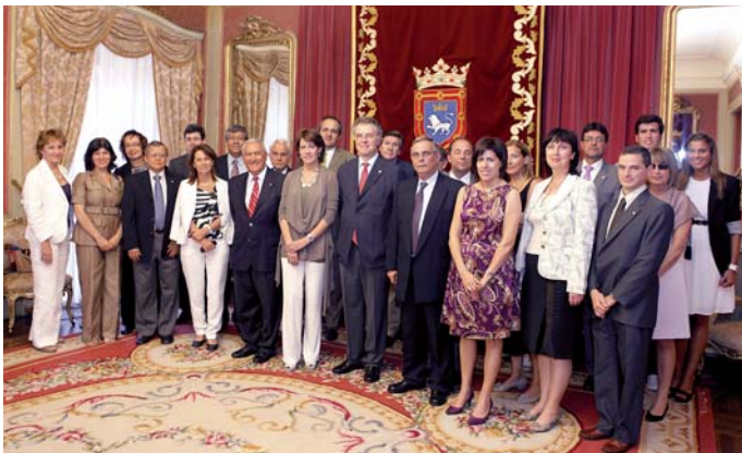
Recepción en el Ayuntamiento de Pamplona a los directores regionales de la AUIP

■ Las siguientes instituciones fueron admitidas como socios de número, durante 2010: