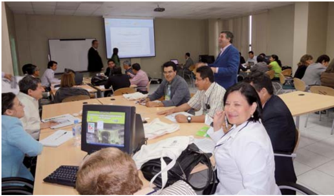
Taller de trabajo