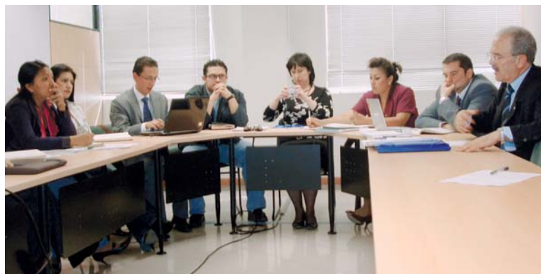
Misión Técnica en la Universidad Técnica Particular de Loja, Ecuador