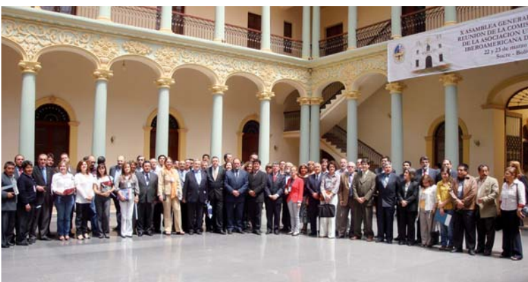
Asistentes a la Asamblea General en Sucre, Bolivia