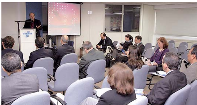
Reunión Técnica Internacional de la RedPymes en Sao Paulo, Brasil

La Red hizo su presentación oficial ante los asistentes a la ceremonia de entrega de los Premios AUIP a la Calidad del Postgrado (Guadalajara, México) y, convocados por la Secretaría General Iberoamericana, presentó, junto con la Fundación para el Análisis Estratégico y Desarrollo de la Pequeña y Mediana Empresa-FAEDPYME, los resultados de un macro-estudio sobre la situación actual de las mPymes en el ámbito iberoamericano (Casa de las Américas, Madrid, 13 de julio de 2010).