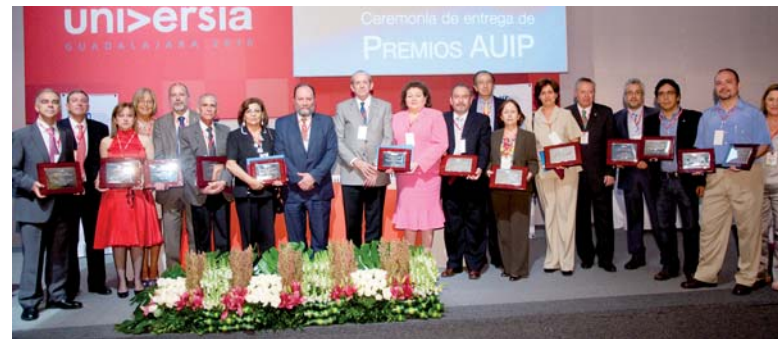
Clausura de la ceremonia de entrega de los Premios AUIP a la Calidad