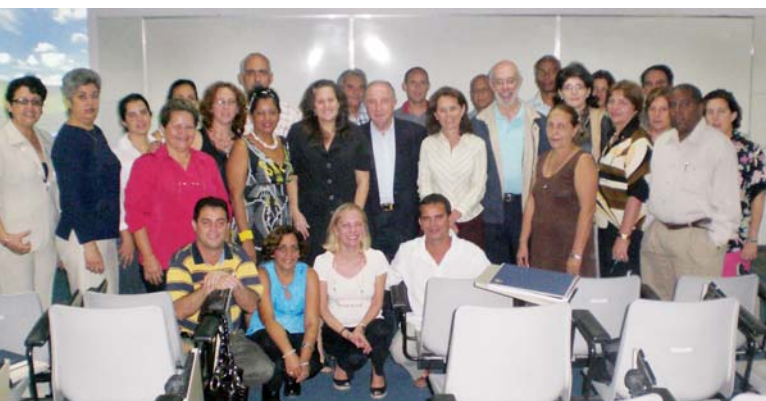
Profesores y alumnos del Curso de Experto en Gestión

Para el próximo curso académico ha sido ya aprobada la puesta en marcha de dos nuevos programas de doctorado iberoamericano. El programa en Recursos Naturales, Agricultura y Agroalimentación liderado por la Universidad de Almería (España) y el programa en Sistemas Inteligentes y "Soft Computing" organizado por la Universidad de Granada (España).