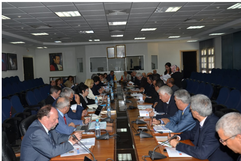
Encuentro de rectores marroquíes, julio de 2013