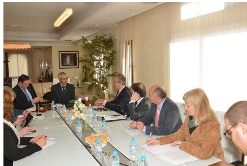
Reunión Crue Universidades Españolas, CPU Maroc y El Ministerio de Educación de Marruecos, marzo de 2016