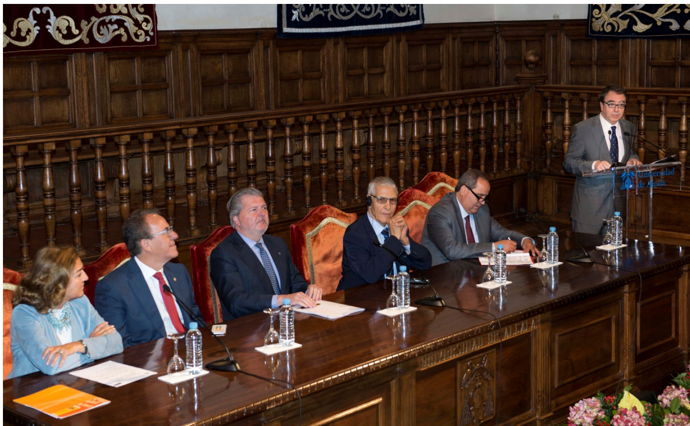
Encuentro de universidades españolas y marroquíes, mayo de 2016