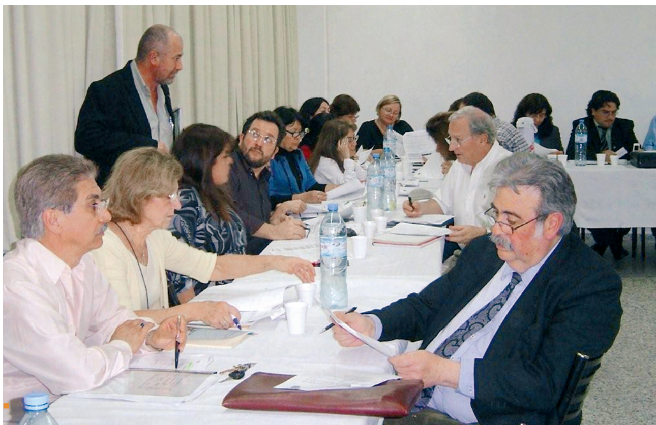
Reunión en la Universidad Nacional del Nordeste, 3 y 4 de julio de 2008