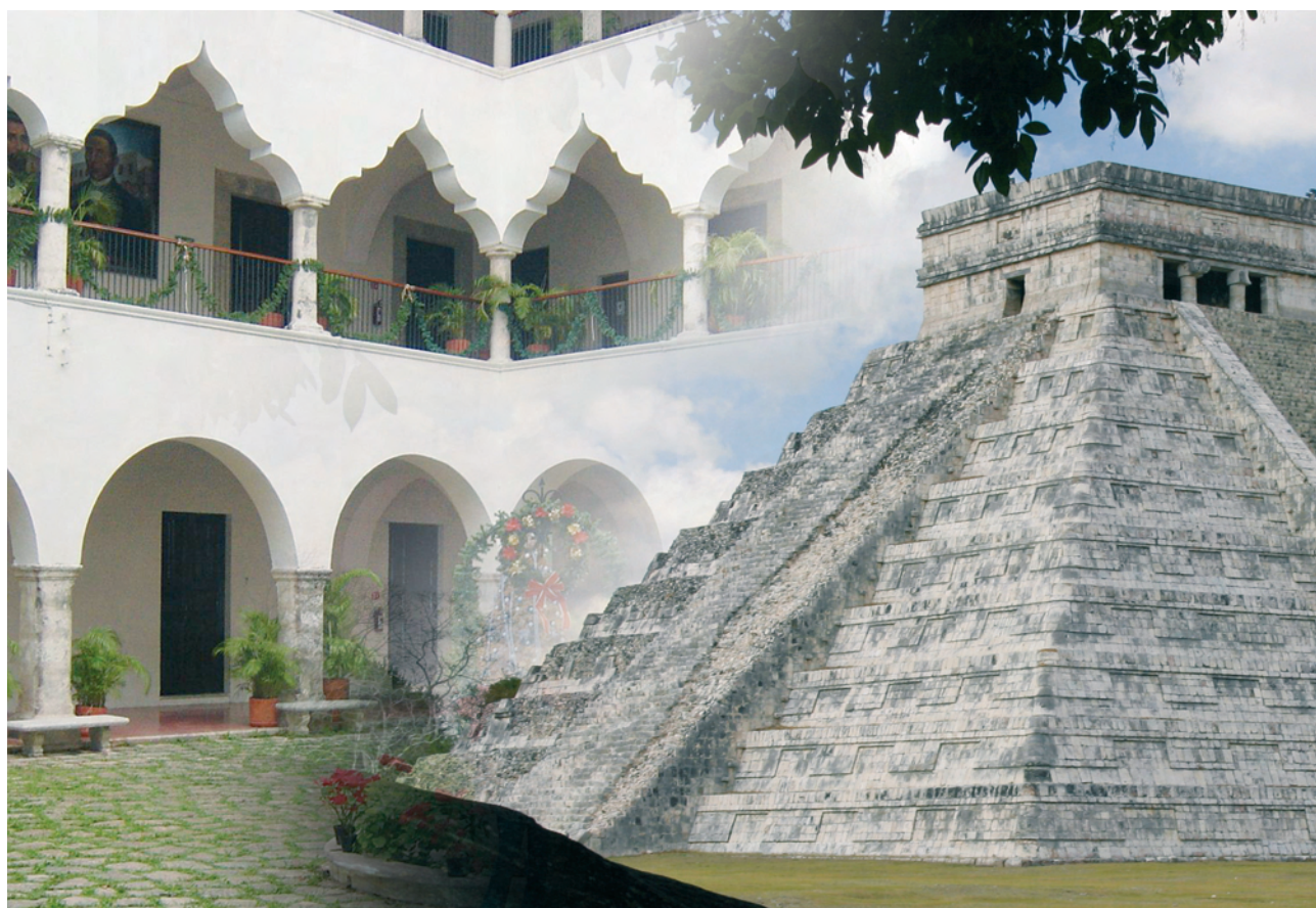
Universidad Autónoma de Yucatán. Ruinas de Chichen-Itza (México)