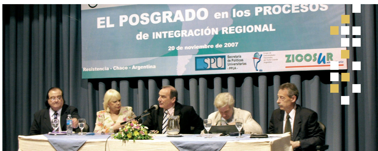
Universidad Nacional del Nordeste, Argentina 20 de noviembre de 2007