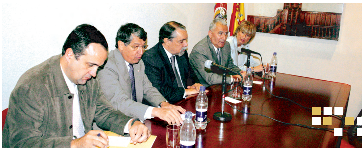
Bogotá, octubre 2007