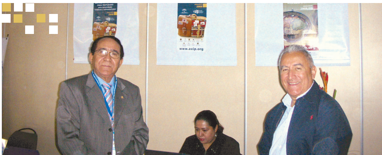
Universidad Autónoma de Guadalajara, noviembre 2007