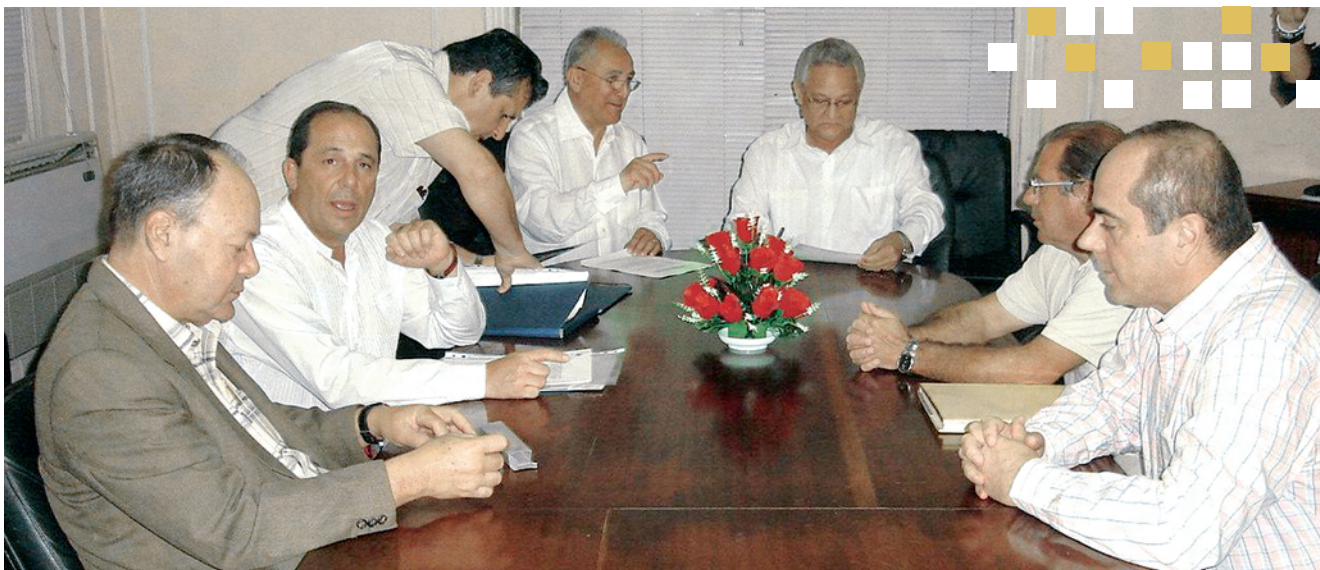
Firma de convenios en La Habana, diciembre 2007

- Doctorado Iberoamericano en Ciencias Básicas , Universidad de Cádiz en colaboración con la Universidad de La Habana.