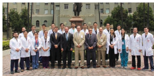
Profesores de la especialidad en Cirugía General y autoridades de la Univ. Autónoma de Nuevo León, México, junto al equipo internacional de evaluadores enviado por la AUIP (25 de mayo de 2019).