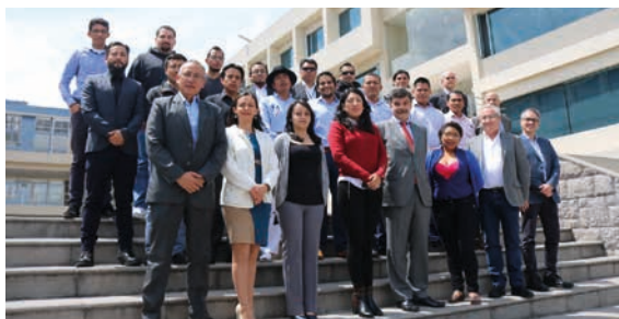
Alumnos y profesores del Curso presencial de Introducción a la Investigación en Ingenierías y Ciencias Técnicas celebrado en la Universidad Tecnológica Indoamérica, Quito (Ecuador).