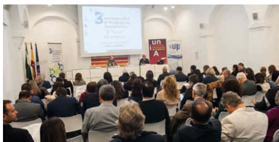
Vista general de una de las sesiones de las III Jornadas sobre el Postgrado en Iberoamérica (UNIA, Sevilla, enero 2019).