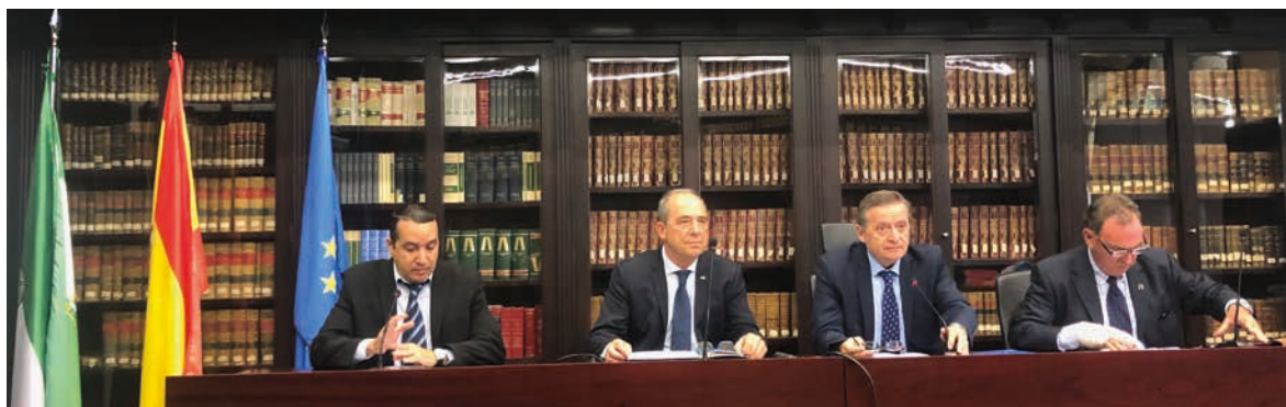
Inauguración del Congreso Internacional de Derecho del Deporte: II Encuentro de Investigadores en Derecho y Gestión del Deporte.