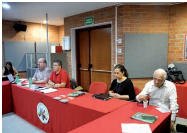
Sessão de trabalho na visita dos pares acadêmicos à Universidade de Medelim para avaliar o Mestrado em Comunicação.