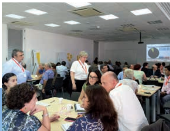
Primeiras Jornadas de Internacionalização sobre a Pós-graduação em Ibero-américa realizadas em Rábida, de 19 a 23 de setembro de 2016.