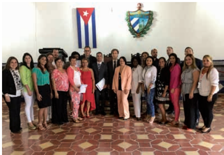
Primeiro Encontro Internacional de Trabalho da Rede REDIJEJA (Santiago de Cuba, 8, 9 e 10 de novembro de 2017).