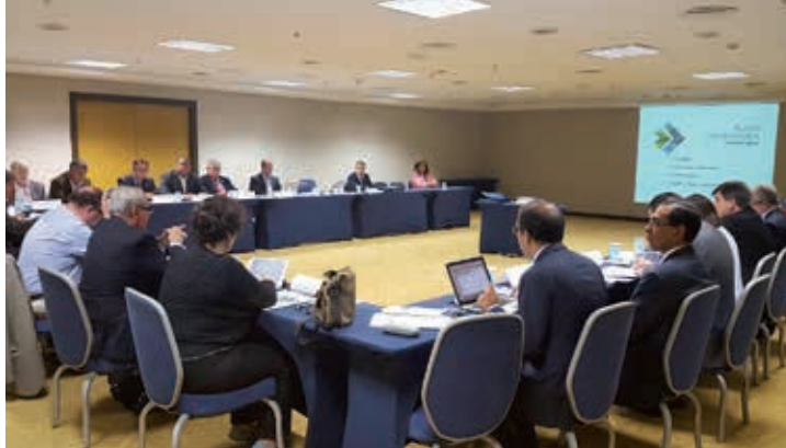
2ª Reunião da Comissão Executiva, Universidade Estadual Paulista São Paulo, Brasil, 10 e 11 de outubro de 2016.