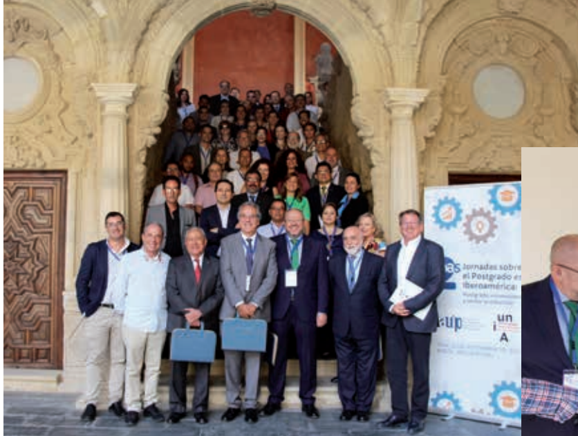
Segundas Jornadas de Internacionalização sobre a Pós-graduação em Ibero-América realizadas em Baeza, de 19 a 22 de setembro de 2017.