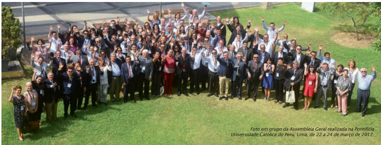
Foto em grupo da Assembleia Geral realizada na Pontifícia Universidade Católica do Peru, Lima, de 22 a 24 de março de 2017.