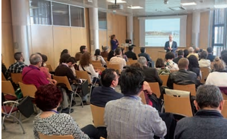
IV Congresso Internacional intitulado "Ecosistemas de inovação e vinculação União Europeia-América Latina (Vuela)" celebrado pela Rede Universidade-Empresa ALCUE (Granada, de 26 a 28 de outubro de 2016).

Este evento reuniu mais de 60 pesquisadores procedentes de 40 instituições acadêmicas da Argentina, Bolívia, Brasil, Chile, Colômbia, Espanha, Equador, México, Peru e Venezuela.