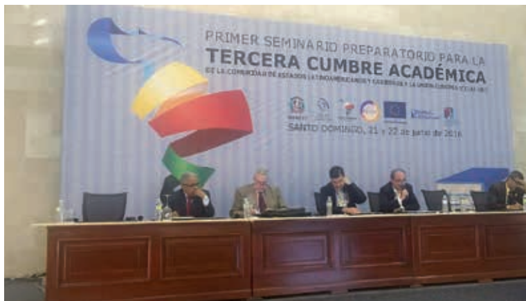
Primeiro Seminário Preparatório da Comunidade de Estados latino-americanos e caribenhos e da União Europeia (CELAC-UE), realizada em Santo Domingo, República Dominicana, 21 e 22 de junho de 2016.