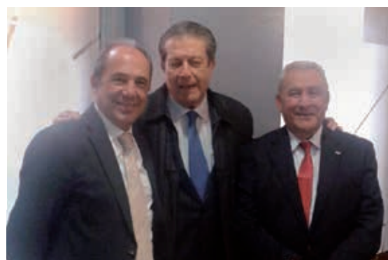
Encontro do Diretor Geral e o Diretor Adjunto da AUIP com Sr. Federico Mayor Zaragoza, em 13 de maio de 2016, em Granada.