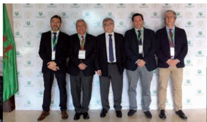
Acima: Imagens da primeira edição do Seminário TCUE, Barranquilha, Colômbia, 30 e 31 de janeiro de 2017 Abaixo: Foto em grupo da segunda edição do Seminário, Valparaíso, Chile, 15 e 16 de novembro de 2017