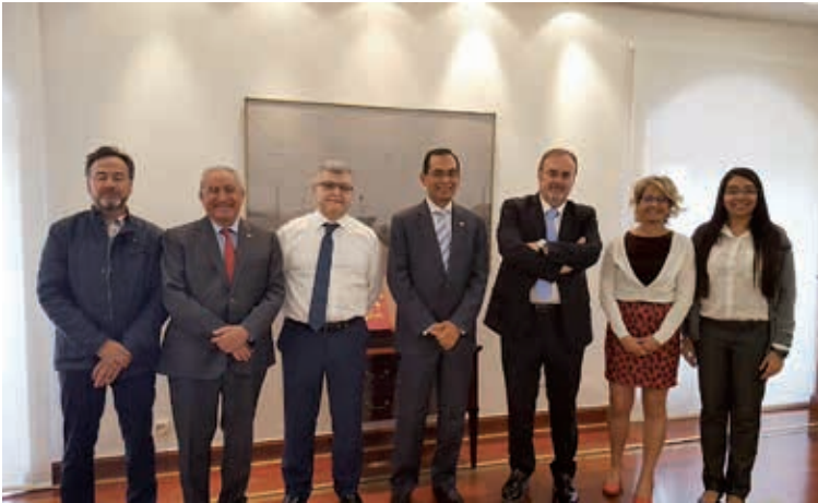
Encontro com o Conselheiro de Educação da Junta de Castela e Leão. Valladolid, 6 de abril de 2017.