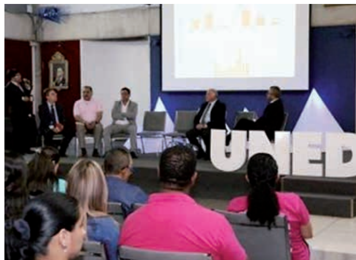
II Congresso Ibero-americano de Pesquisa em MIPYMES (Rede FAEDPYME) Universidade Estatal à Distância da Costa Rica, 20 e 21 de abril de 2017.