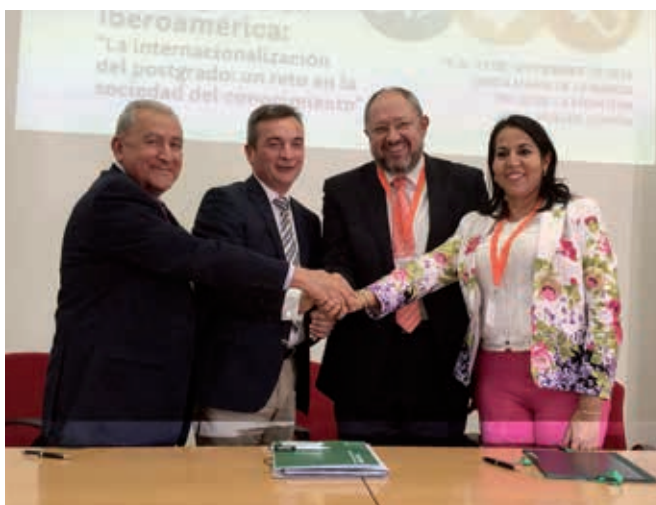
Assinatura do Convênio de colaboração institucional para a realização do Doutorado em disciplinas relacionadas com Arte (La Rábida, Huelva, 23 de setembro de 2016).