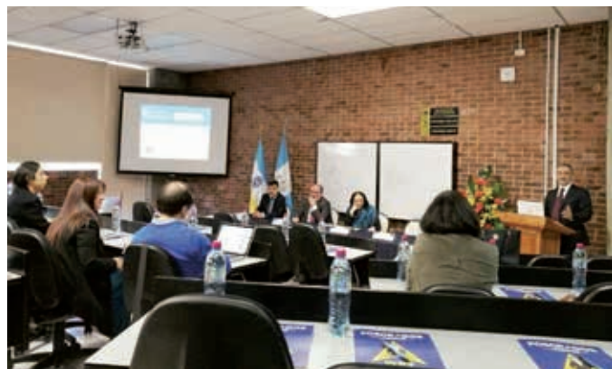
Ato de inauguração da Missão Técnica na Universidade Rafael Landívar, Guatemala, de 26 a 28 de outubro de 2016.