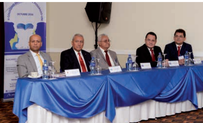
III Colóquio Internacional do Sistema de Pós-graduação da Universidade Nacional de Engenharia (Manágua, Nicarágua).