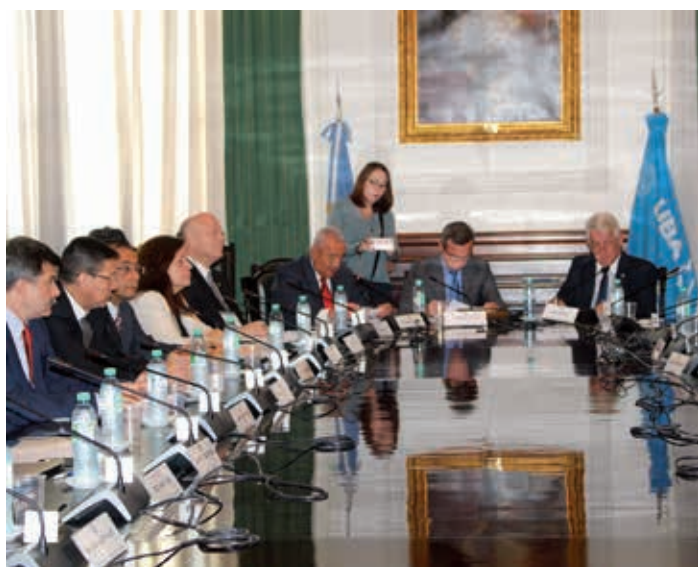
2ª Reunião da Comissão Executiva, Buenos Aires, Argentina, 26 e 27 de outubro de 2017.