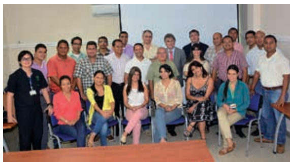
Los participantes en el curso de Complementos Formativos del Programa Iberoamericano de Formación Doctoral en Ciencias Básicas. Barranquilla, Colombia