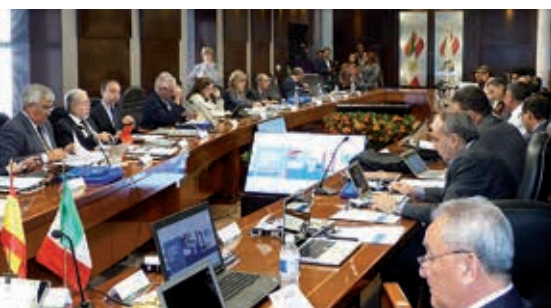
Reunión de la Comisión Ejecutiva de la AUIP, Aguascalientes, México