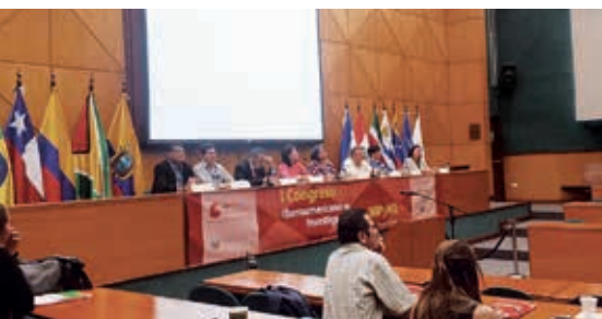
Sesión de trabajo del I Encuentro Iberoamericano de Investigación en MIPYME