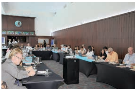
Sesión de trabajo