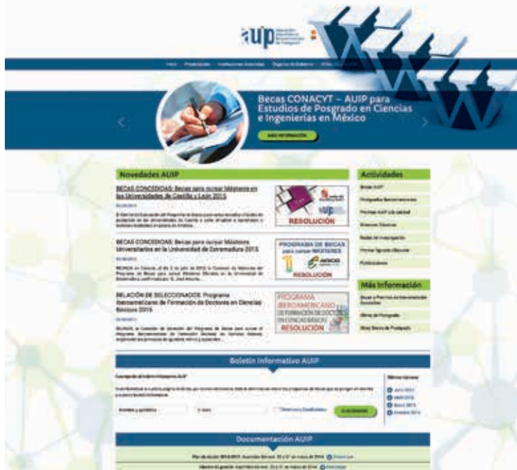
Fotos de la nueva página web de la asociación y apartado de inscripción para acceder al módulo piloto