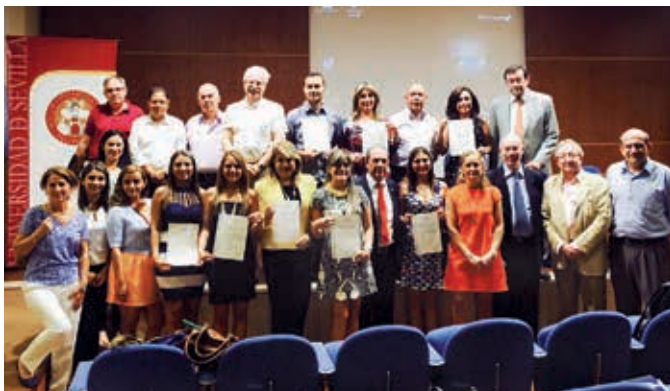
Acto de clausura de la fase presencial de la Maestría en Gestión de la Ciencia, la Tecnología, la Innovación y la Política Científica, celebrado en la Escuela Internacional de Postgrado y Doctorado de la Universidad de Sevilla, con la entrega de los certificados a los 32 alumnos que participaron en el programa