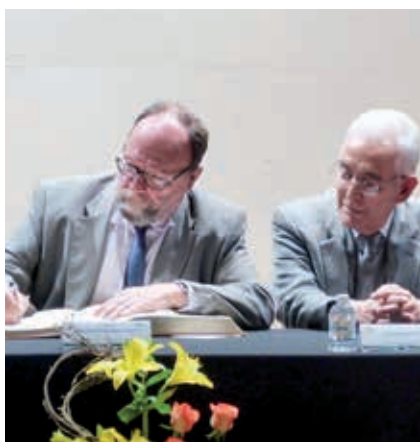
Fotos de la Asamblea General ordinaria, Aguascalientes, México, 19 y 20 de marzo de 2015