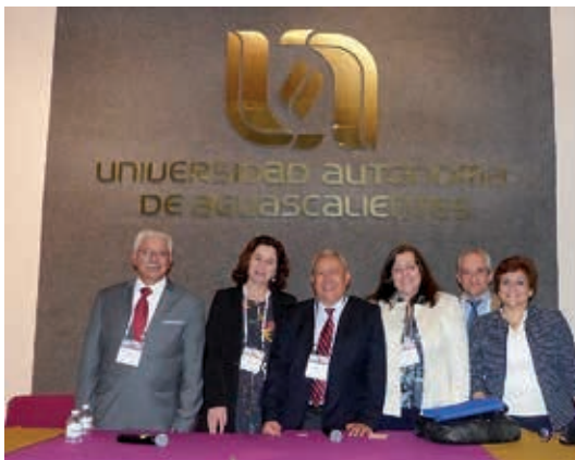
Los coordinadores de las redes asistentes al Encuentro Internacional de Redes Nacionales e Internacionales de Postgrado en Aguascalientes, México, el 18 de marzo de 2015

Las siguientes fueron las redes participantes: