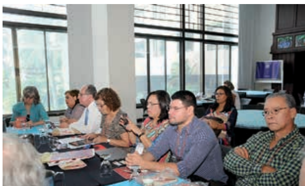
Sesión de trabajo