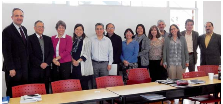
Participantes en la Misión Técnica celebrada en la Pontificia Universidad Católica del Perú