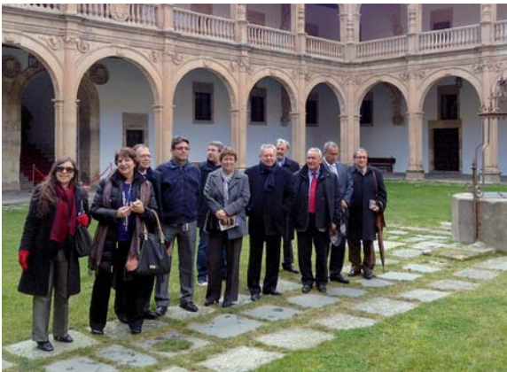
Participantes en la 3ª Reunión Internacional sobre Calidad. Universidad de Salamanca, 9 y 10 de febrero de 2014