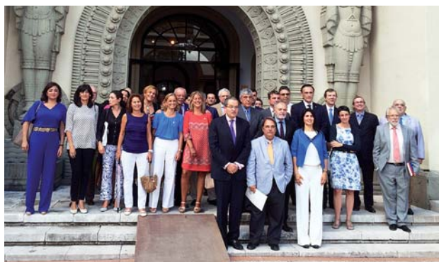
Foto de familia: participantes en el Coloquio celebrado en el Consulado de Colombia en Sevilla, 18 de septiembre de 2014