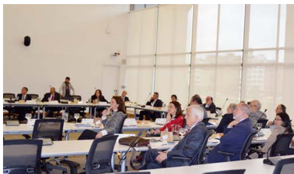
Reunión de la Comisión Ejecutiva de la AUIP. Universidad Nacional de Colombia