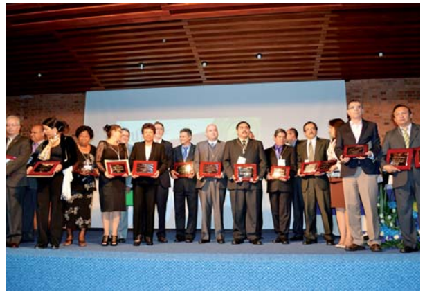
Los galardonados con el Premio AUIP a la Calidad. Universidad Nacional de Colombia. Bogotá, 20 de marzo de 2014