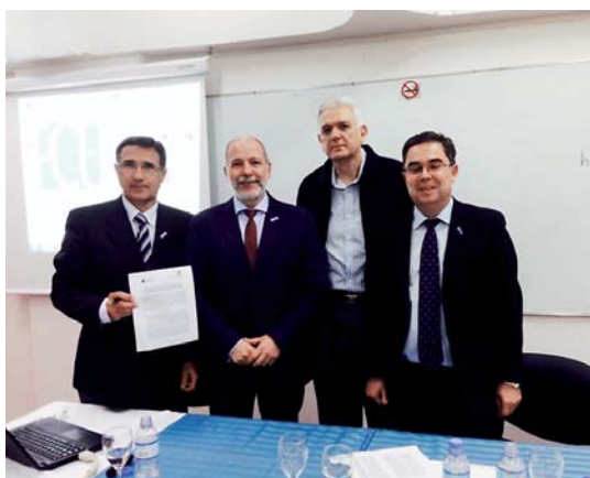
Los coordinadores de FAEDPYME en la reunión celebrada en la Universidad de La Plata, Argentina (22 y 23 de mayo de 2014)