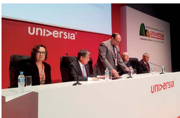
Participación de la AUIP en el Encuentro de Universia en Río de Janeiro