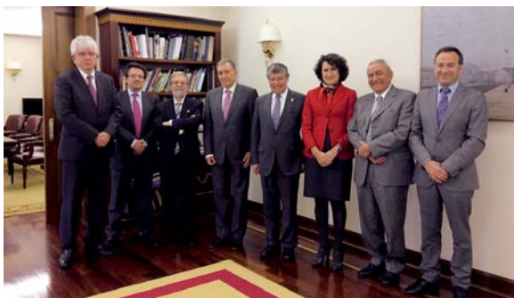
El Consejero de Educación de Castilla y León, junto a los Rectores de las universidades públicas de CyL, el Rector de la Universidad del Valle (Colombia), el Director General de la AUIP y el Gerente de FUESCYL. Valladolid 22 de mayo de 2014