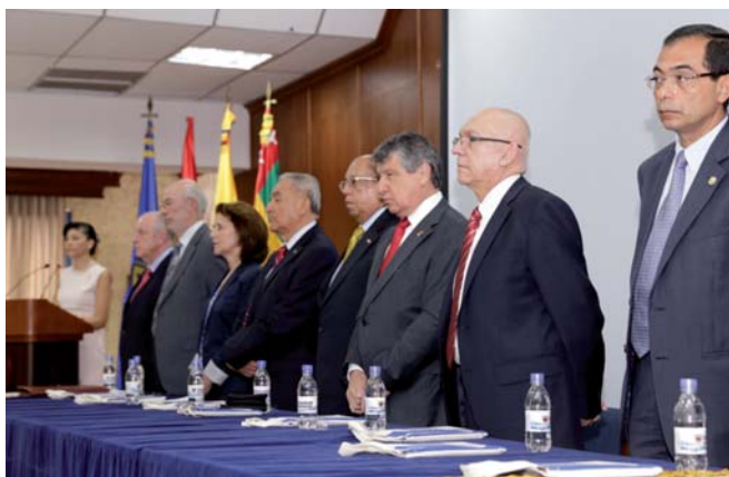
Inauguración del Máster en Gestión de Ciencia y Tecnología. Universidad de Santander. Bucaramanga 1 de julio de 2014