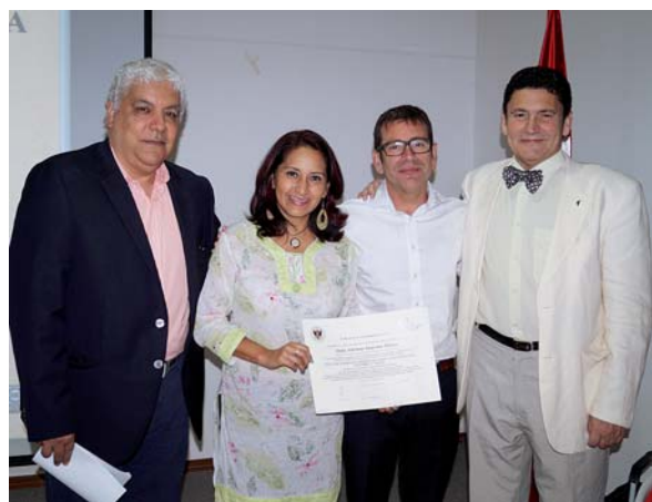
Alumnos y responsables del Doctorado en Gestión de la Paz y los Conflictos. Universidad del Valle. Cali, 11 de junio de 2014