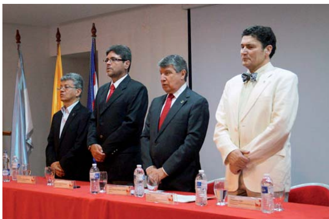
Inauguración del acto de entrega de certificados del Curso de Experto en Gestión de la Paz y los Conflictos. Universidad del Valle. Cali, 11 de junio de 2014