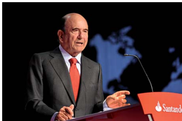
D. Emilio Botín-Sanz de Sautuola

Se le concedió el Premio “Ignacio Ellacuría” a la Cooperación al Desarrollo de los Estudios de Postgrado en Iberoamérica al Grupo Santander, Subdivisiones Santander Universidades y Universia, en la persona de su Presidente, D. Emilio Botín-Sanz de Sautuola García de los Ríos.