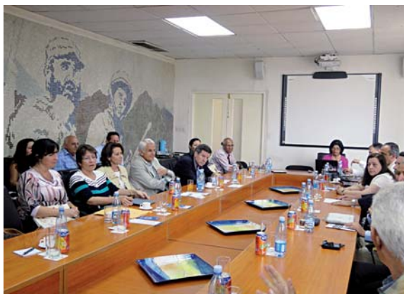
Reunión para la revisión de la Guía AUIP de Evaluación. Ministerio de Educación Superior de Cuba. La Habana