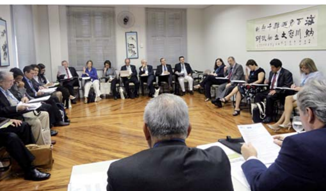
Reunión de la Comisión Ejecutiva. UNESP, Sao Paulo, Brasil