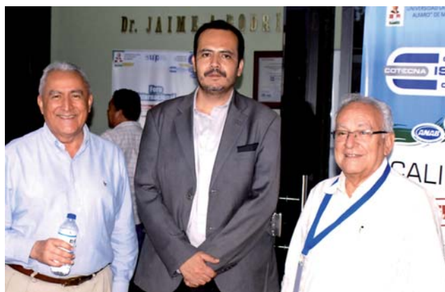
Foro Internacional sobre Modelos de Investigación. ULEAM. Ecuador