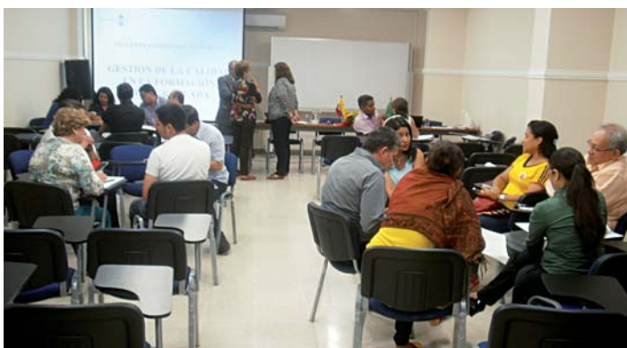
Taller sobre Gestión del Postgrado. Univ. Simón Bolívar, Barranquilla, Colombia