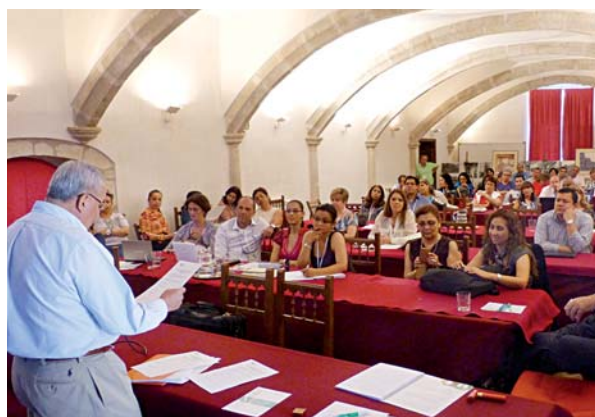
Curso Internacional sobre la Calidad del Postgrado en Iberoamérica. Univ. de Extremadura. Trujillo, España