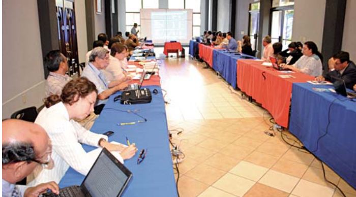
Reunión de la Red Faedpyme. Univ. Nacional de Ingeniería. Managua