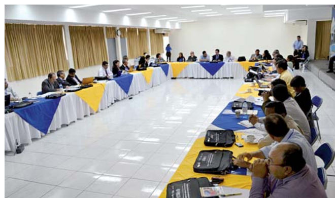
Sesión de trabajo en la Univ. Iberoamericana de Ciencia y Tecnología - UNICIT - Nicaragua