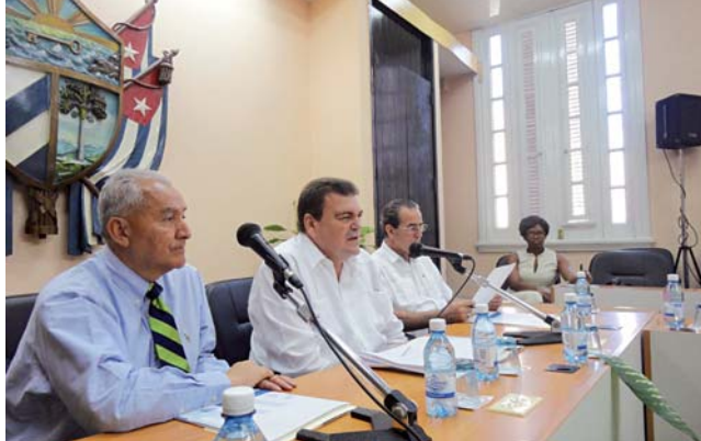
Inauguración de la Reunión de Directores Regionales de la AUIP. De izqda. a dcha.: el Director General de la AUIP, el Rector de la Univ. de La Habana y el Ministro de Educación Superior de Cuba

sión fue propicia para revisar y valorar las actuaciones puestas en marcha durante el año 2012 y primer semestre de 2013 y las que se han previsto para culminar el bienio 2012-2013. Los Directores Regionales participaron, luego, activamente en la I Reunión Técnica Internacional para la revisión y ajuste de la Guía AUIP de Autoevaluación de Postgrados, 6ª edición.