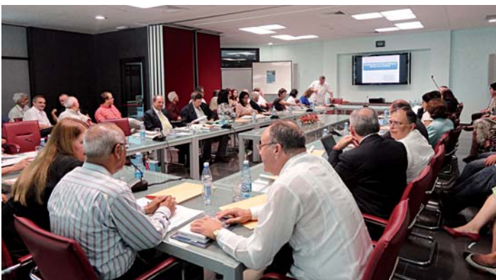
Seminario sobre la Calidad del Postgrado. CUJAE, La Habana