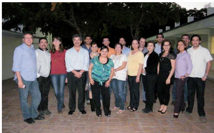
Alumnos del Doctorado en Gestión de la Paz y los Conflictos. Univ. Autónoma de Sinaloa, México