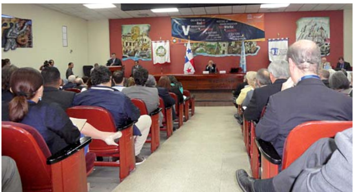
Encuentro IESALC - UNESCO. Univ. de Panamá