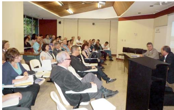
Participação do diretor geral adjunto na apresentação da Rede Iberoamericana de pesquisadores sobre Leibniz. Universidade da Costa Rica, julho 2012

■ A AUIP presidiu no dia 11 de julho a constituição da Rede Iberoamericana de Pesquisadores em Filosofia que foi realizada na Universidade da Costa Rica em San José. O Diretor Geral Adjunto participou oferecendo uma conferência na qual foram apresentadas as atuações que nossa associação realiza na promoção da pesquisa e no desenvolvimento dos estudos de pós-graduação em Iberoamérica.