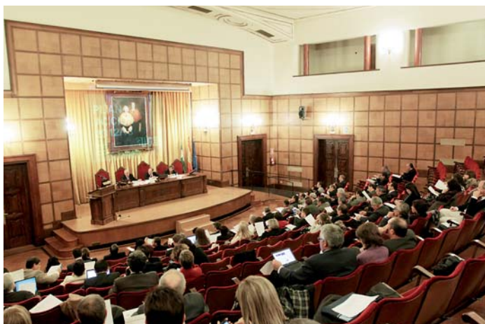
Vista panorâmica da Assembleia Geral da AUIP. Universidade de Granada, março 2012