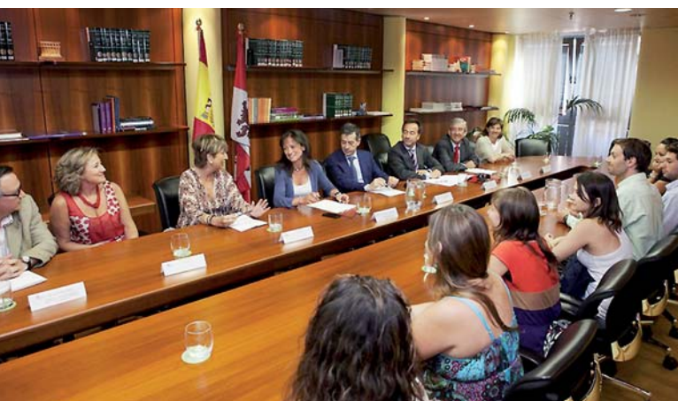
Reunião com bolsistas da 3ª convocatória do programa de bolsas financiado pela Junta de Castilla y León

■ A AUIP convocou conjuntamente com a Fundação Universidades de Castilla y León e a Direção Geral de Relações Institucionais e Ação no Exterior da Conselheira da Presidência da Junta de Castilla y León, um encontro para a finalização do curso acadêmico (Valladolid, 13 de julho de 2012) com os 19 bolsistas da terceira convocatória do Programa de Bolsas para cursar estudos de máster dirigido a castelhanos y leoneses residentes na América Latina. Do mesmo modo, foi realizada uma reunião de seguimento dos bolsistas da quarta convocatória do mesmo programa de bolsas (Valladolid, 3 de dezembro de 2012).