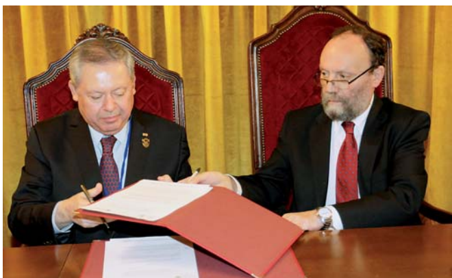
Os reitores da Universidade Autónoma de Sinaloa e da Universidade de Granada firmando o convênio para a realização do Doutorado Iberoamericano em Gestão da Paz e dos Conflitos