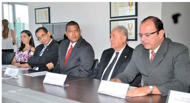
Apresentação da RIFIP. Universidade Simón Bolívar, Barranquilla, 20 de novembro de 2012