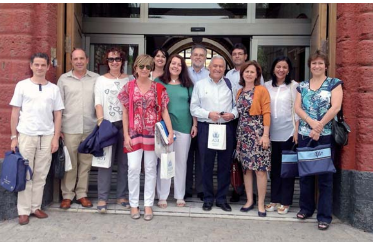
Foto de Grupo: a direção geral da AUIP junto com os diretores regionais

Estratégico de Desenvolvimento da AUIP a médio e longo prazo. A ocasião foi propícia para revisar e avaliar as atuações realizadas durante o biênio 2010-2011 e as que foram previstas no Plano de Ação 2012-2013. Os Diretores Regionais participaram ativamente do “Seminário Iberoamericano sobre o financiamento dos estudos de pós-graduação e a formação permanente na Espanha e América Latina”.