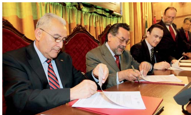
Representantes da Benemérita Universidade Autónoma de Puebla, da Universidade de Córdoba e da AUIP, na assinatura do convênio para o desenvolvimento do Doutorado Iberoamericano em Agro-alimentação

Para todos eles foi definido o “roteiro de trabalho”. Foram convocados os primeiros quatro e foi realizada a seleção dos candidatos. No total, foram admitidos 87 alunos e foram dadas 57 bolsas a alunos dos seguintes países: