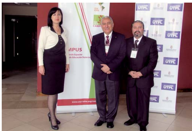
Encontro Internacional sobre pós-graduações e seu vínculo com a coletividade. Universidade Técnica Particular de Loja, maio 2012