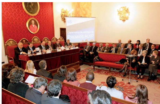
Cerimônia de entrega do Prêmio Ignacio Ellacuría. Universidade de Granada, março 2012