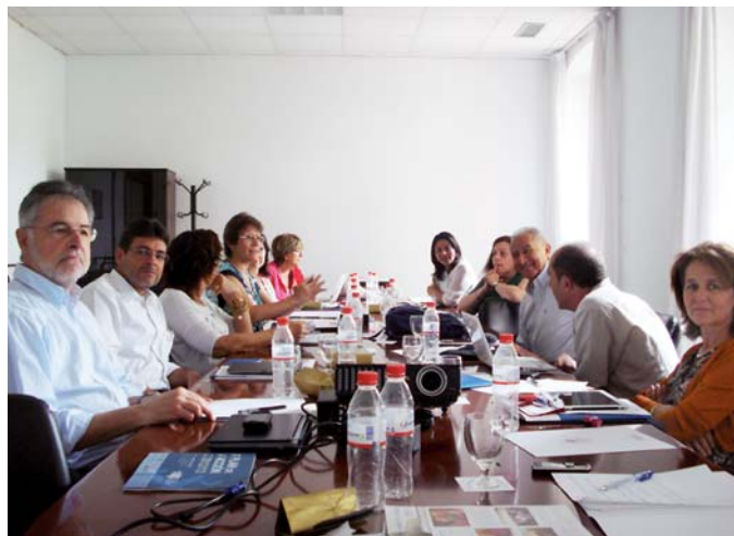
Diretores regionais da AUIP reunidos na Universidade de Cádiz