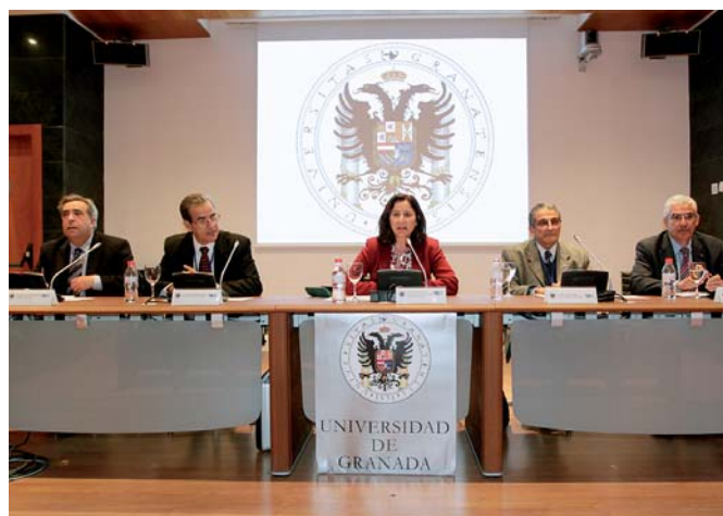
Mesa redonda sobre os doutorados cooperativos Espanha-América Latina, coordenada pela vice-reitoria de Ensino de Graduação e de Pós-graduação da Universidade de Granada