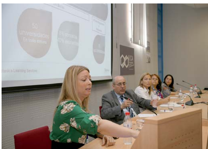
Participação da representante de Telefônica na Mesa Redonda sobre o Financiamento da Pós-graduação. Universidade de Cádiz, junho 2012