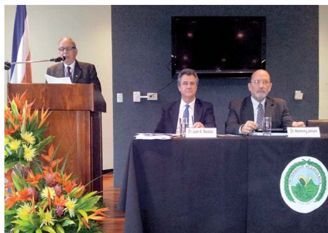
Ato de apresentação da Rede Iberoamericana de pesquisadores sobre Leibniz presidido pelo Reitor da Universidade da Costa Rica