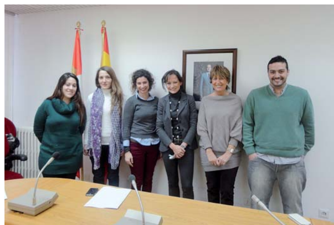
Reunião com bolsistas da 4ª convocatória do programa de bolsas financiado pela Junta de Castilla y León

■ A AUIP firmou um Convênio de Colaboração com a Rede de Educação Continuada da América Latina e Europa (RECLA) com o propósito de aproveitar sinergias, assegurar integração e trabalhar conjuntamente para lograr objetivos comuns em matéria de formação superior avançada, em particular em educação continuada e permanente no âmbito iberoamericano.