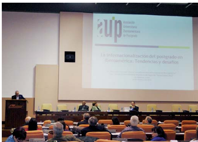
Junta Consultiva sobre a Pós-graduação em Iberoamérica. Palácio de Convenções de La Habana