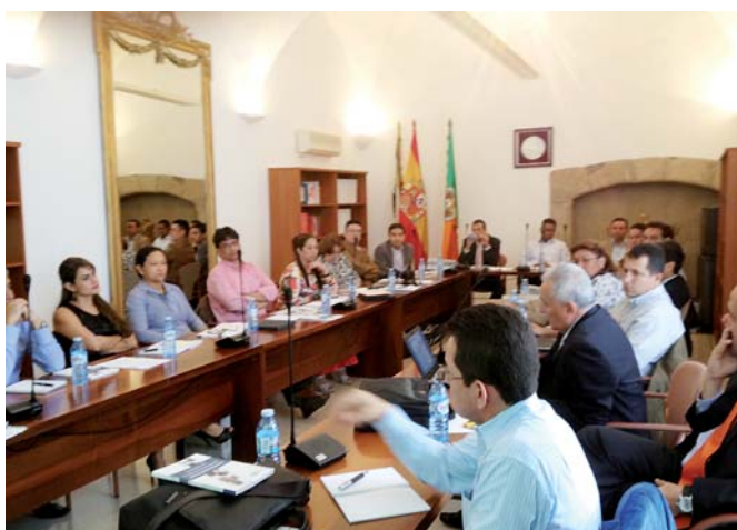
Seminário sobre Cooperação e Gestão Universitária. Universidade de Extremadura, maio 2012