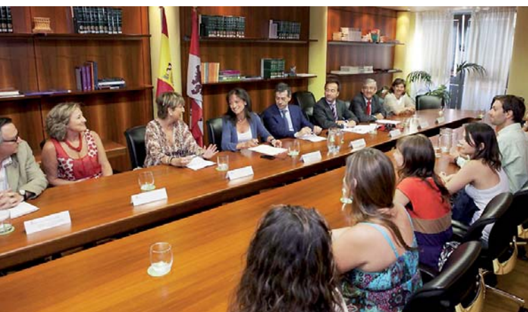
Reunión con becarios de la 3ª convocatoria del programa de becas financiado por la Junta de Castilla y León

■ La AUIP convocó, conjuntamente con la Fundación Universidades de Castilla y León y la Dirección General de Relaciones Institucionales y Acción en el Exterior de la Consejería de la Presidencia de la Junta de Castilla y León, un encuentro con motivo de la finalización del curso académico (Valladolid, 13 de julio de 2012) con los 19 becarios de la tercera convocatoria del Programa de Becas para cursar estudios de máster dirigido a castellanos y leoneses residentes en América Latina. Así mismo, se celebró una reunión de seguimiento de los becarios de la cuarta convocatoria del mismo programa de becas (Valladolid, 3 de diciembre de 2012).