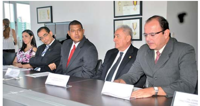
Presentación de la RIFIP. Universidad Simón Bolívar, Barranquilla, 20 de noviembre de 2012

■ A la consideración de la Comisión Ejecutiva han llegado tres nuevas propuestas: