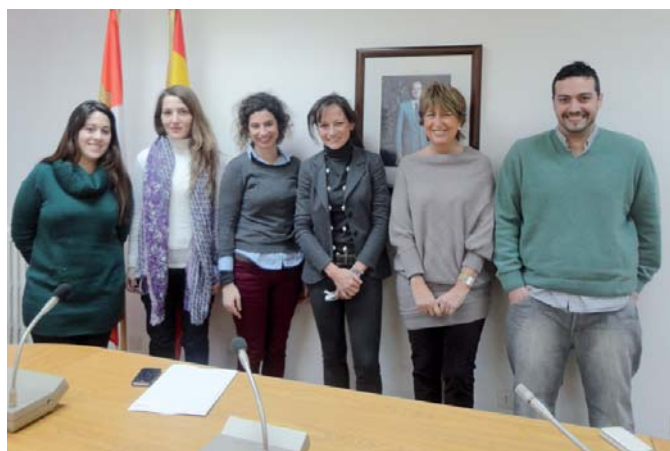
Reunión con becarios de la 4ª convocatoria del programa de becas financiado por la Junta de Castilla y León

■ La AUIP suscribió un Convenio de Colaboración con la Red de Educación Continua de Latinoamérica y Europa (RECLA) con el propósito de aprovechar sinergias, asegurar integración y trabajar conjuntamente hacia el logro de objetivos comunes en materia de formación superior avanzada, en particular, en educación continua y permanente en el ámbito iberoamericano.