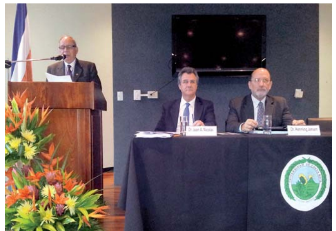
Acto de presentación de la Red Iberoamericana de investigadores sobre Leibniz presidido por el Rector de la Universidad de Costa Rica