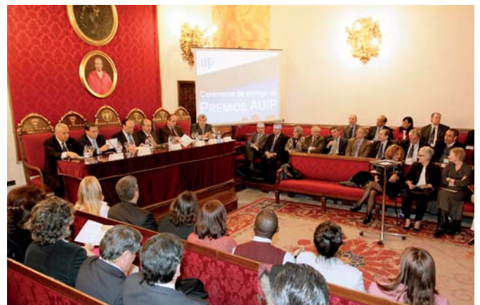
Ceremonia de entrega del Premio Ignacio Ellacuría. Universidad de Granada, marzo 2012