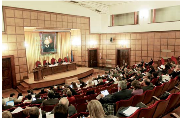
Vista panorámica de la Asamblea General de la AUIP. Universidad de Granada, marzo 2012